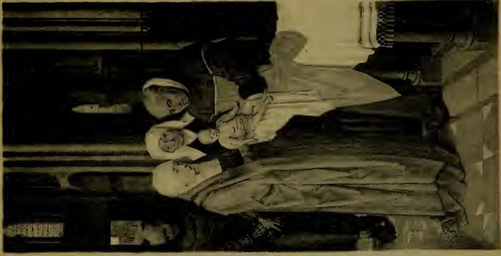
La Nativité et la Présentation au temple Volets du triptyque : l'Adoration des Mages.